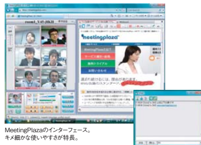
MeetingPlazaのインターフェース。 キメ細かな使いやすさが特長。

*株式会社シードプランニング「2008年度版テレビ会議/Web会議の最新市場動向とHD化傾向」調査報告書(2008年3月)より