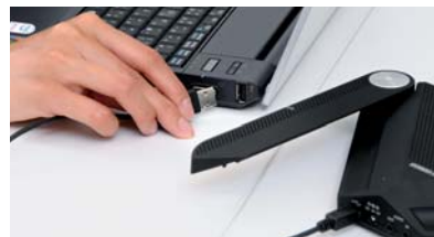
小型で軽量。USBバスパワーにより、PCと接続するだけで使用可能。